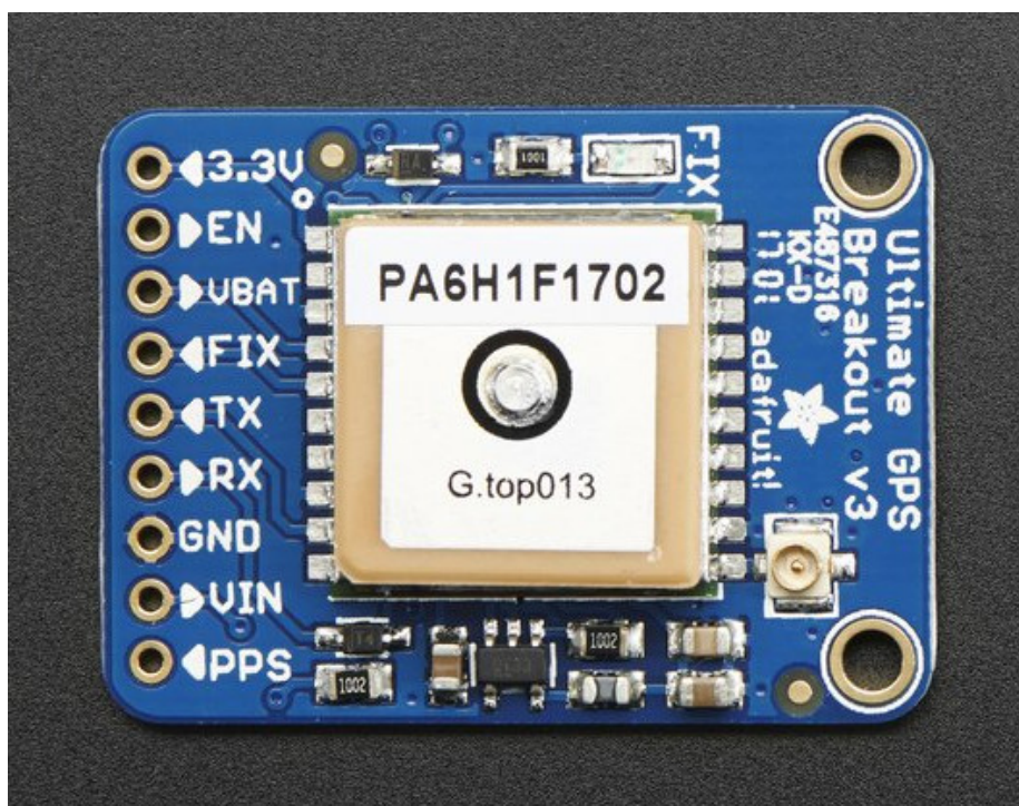
Abbildung 1: Anschlussbelegung des PA6H/MTK3339 Breakout-Boards.

In Abbildung 1 sind die Anschlusspins der Platine des GPS Moduls dargestellt. Für die Verwendung des Moduls wird nur ein Teil davon benötigt. Führen Sie die notwendige Verdrahtung auf dem Steckbrett durch.